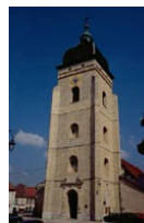
Eglise Ste Bénigne