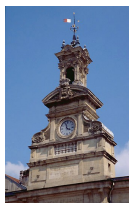
Porte saint Pierre