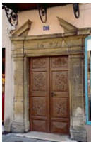
Rue de la République